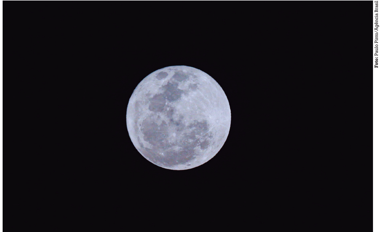
Superluas estão entre os eventos que poderão ser vistos a olho nu de qualquer lugar do país; o primeiro deles será o próximo dia 15

A astrônoma destaca que, para quem quiser acompanhar o fenômeno com mais detalhes, haverá observação remota pelo canal do YouTube na instituição. “Nós, do Observatório Nacional, pelo projeto Céu em Sua Casa, também vamos transmitir e fazer uma ação nacional de observação da Lua, que será uma coisa muito boa para chamar as pessoas para a as-