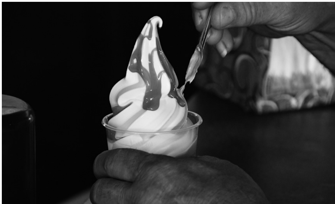
Para refrescar no verão