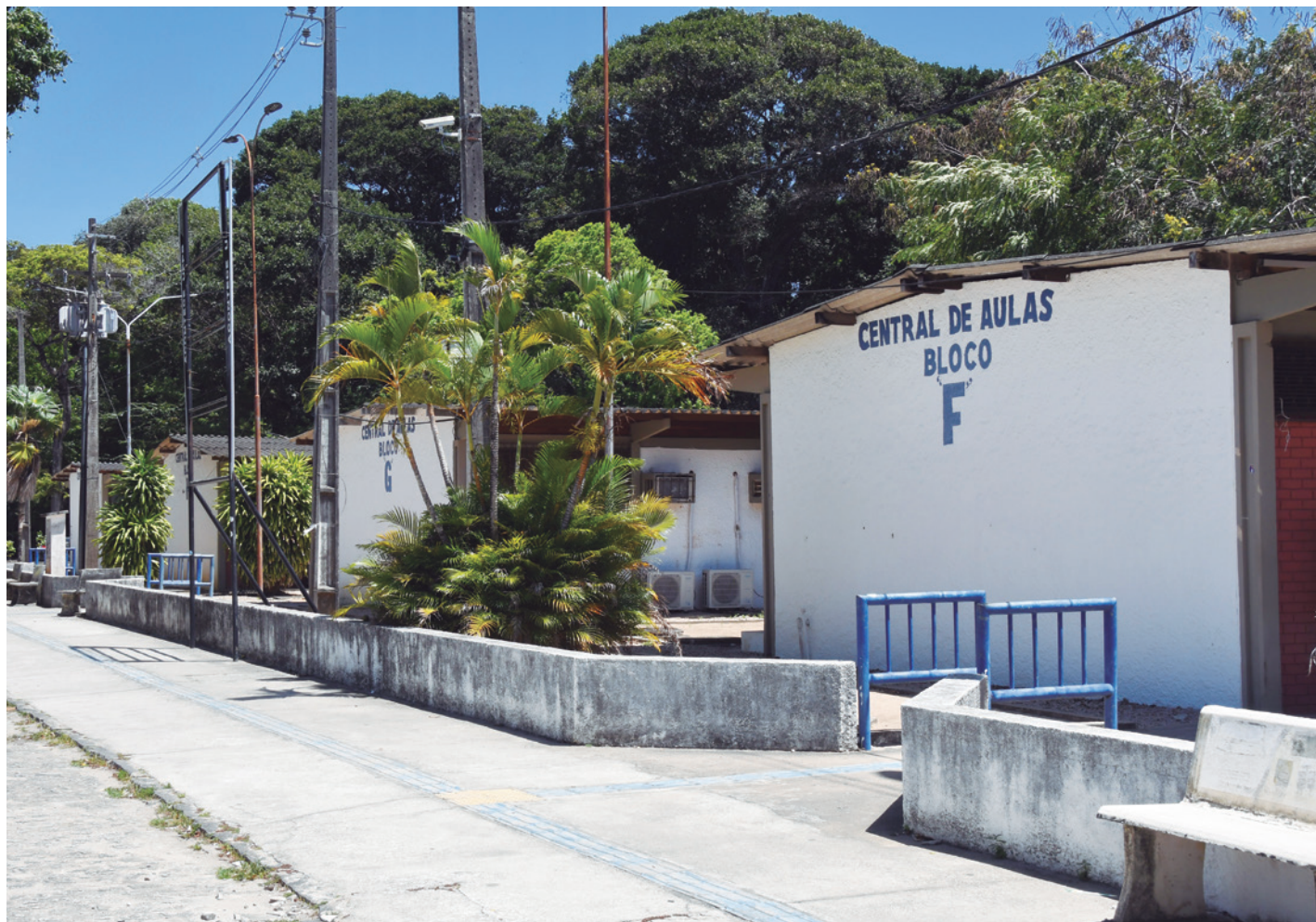
Universidade Federal da Paraíba é a que oferece mais oportunidades para os estudantes, com cerca de 8 mil vagas

No Sisu, o aluno poderá se inscrever em até duas opções de cursos superiores. Porém, a especialista alerta para a escolha das vagas, já que, se aprovado em uma delas, o candidato perde a chance de ingressar na outra alternativa de graduação. “É essencial que o estudante, ao fazer a sua escolha, tenha realmente ciência de que a primeira e a segunda opção são os cursos com os quais ele tem afinidade e interesse em estudar, porque, ao sair o resultado, caso positivo, ele não poderá mais optar por aguardar