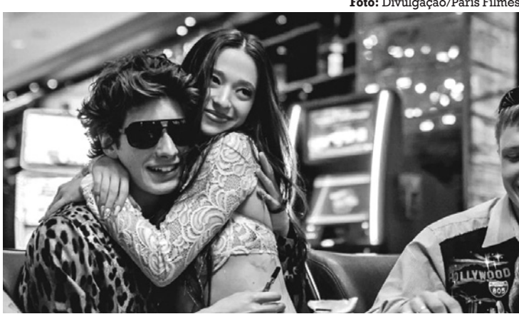
“Anora” e sua atriz, Mikey Madison: fortes nos prêmios de 2025

O filme baseia-se na história de Anora (Mikey Madison), uma jovem prostituta do Brooklyn que se casa por impulso com um oligarca russo.