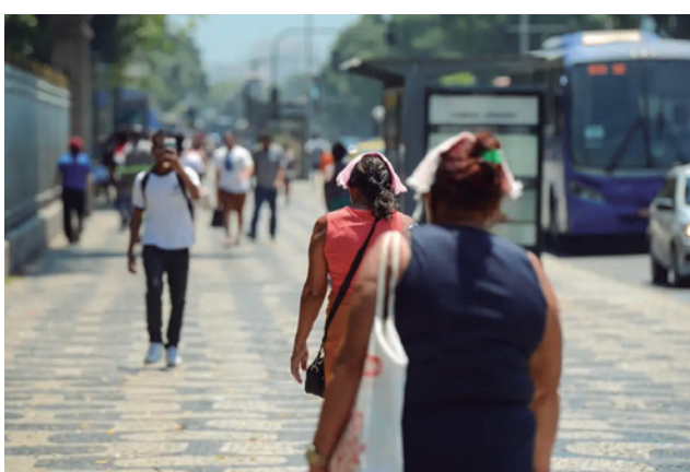
Temperatura ficou 0,79 °C acima da média histórica

Em áreas pontuais do Amazonas, Amapá, sudoeste do Paraná, leste de Santa Catarina e sul do Rio Grande do Sul, são previstas temperaturas próximas ou ligeiramente abaixo da média, devido à ocorrência de dias consecutivos com chuva que podem amenizar a temperatura, destaca o Inmet.