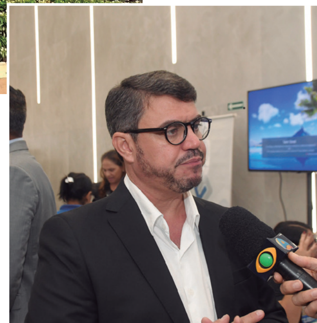
Dinho espera concluir a obra da nova sede da CMJP

“Vamos continuar com a responsabilidade que tivemos, nesse último ano, nas oposições, olhando a cidade como um todo, discutindo a situação do meio ambiente — que é uma situação extremamente precária — discutindo a mobilidade urbana da