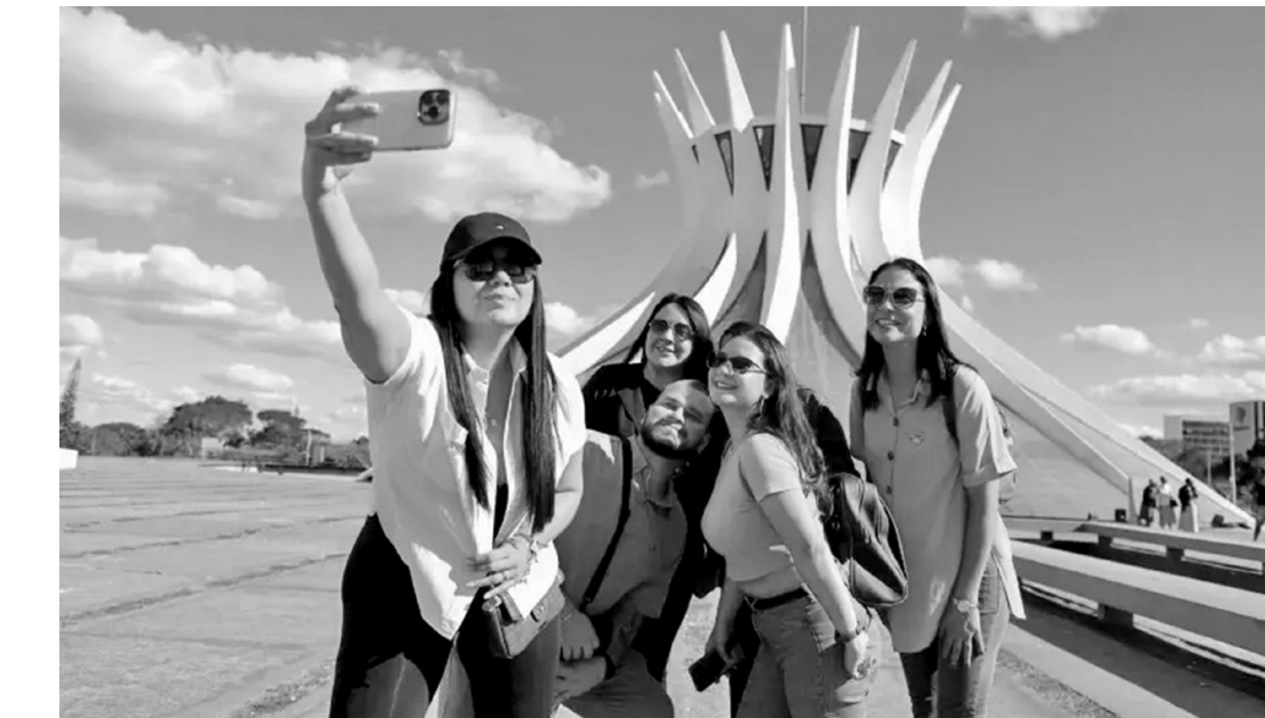
Hospedagem já é responsável por aproximadamente 60% do faturamento dos pequenos negócios da indústria do turismo

Para apoiar os municípios na criação e estruturação do turismo, o Sebrae desenvolve o programa Agentes de Roteiro Turístico (ART), que já atendeu mais de 18,2 mil pequenos negócios, em mais de 700 municípios, com a promoção de 283 roteiros em 176