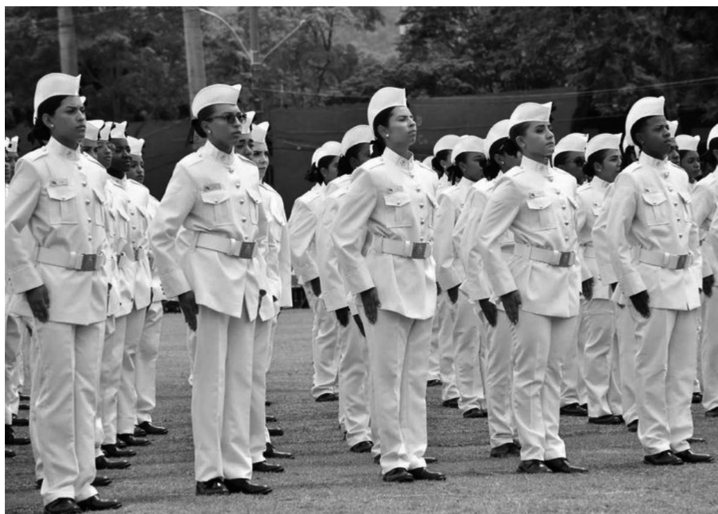
Forças Armadas disponibilizaram 1.465 vagas, em todo o país, para mulheres nascidas em 2007

As Forças Armadas possuem 37 mil mulheres, o que corresponde a cerca de