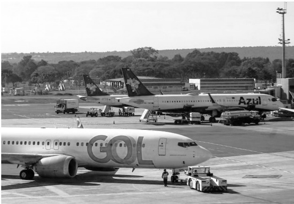
Os acordos com Gol e Azul preveem descontos sobre multas, juros e demais encargos