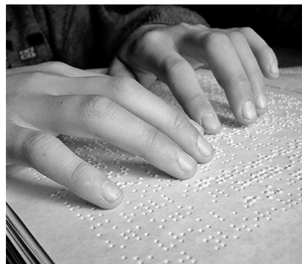
O sistema é baseado em células por seis pontos em relevo

No Dia Mundial do Braille, celebremos a contribuição significativa desse sistema tátil para a inclusão e independência das pessoas cegas. Na busca por um mundo mais inclusivo, a Apabex reafirma seu compromisso em promover a acessibilidade, reconhecendo o Braille como uma ponte fundamental para a realização profissional e pessoal das pessoas com deficiência visual. Juntos, podemos construir um futuro em que as oportunidades são acessíveis a todos.