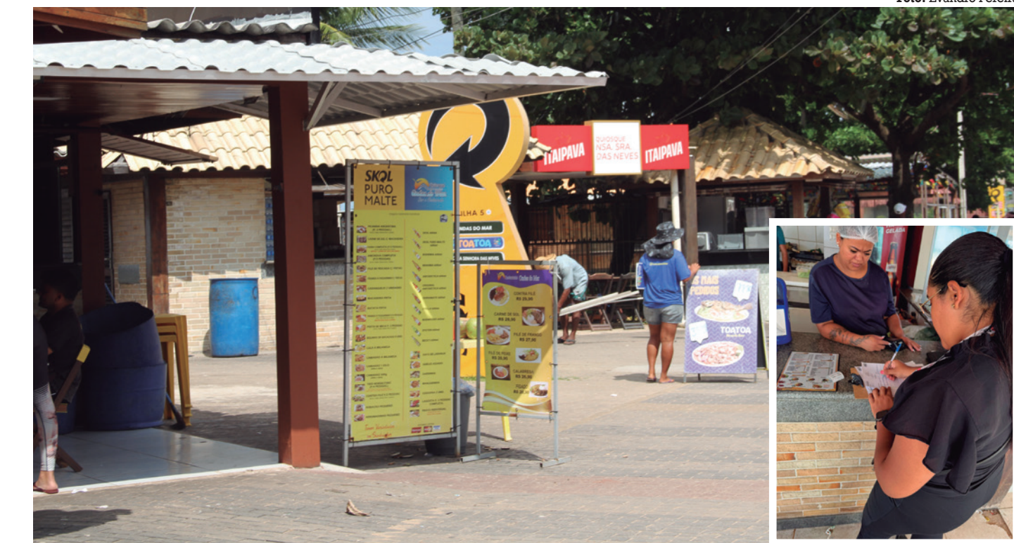
Proprietários de locais notificados terão de apresentar comprovantes fiscais e justificar valores atualmente cobrados

“O que vamos coibir é a prática do aumento abusivo e injustificável de preços, que vem sendo denunciada pela população e por visitantes. Trata-se da prática ilícita de se aproveitar do período para promover o aumento extorsivo de preços”, afirmou Rougger. “Estamos diligentes para proteger o consumidor turista,