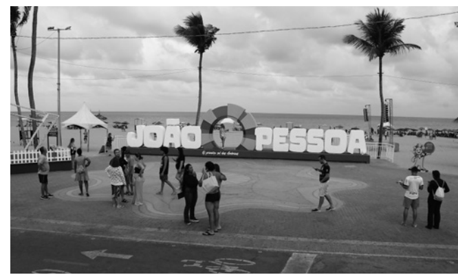
Tráfego próximo ao Busto de Tamandaré terá mudanças