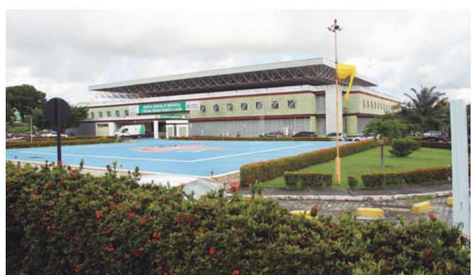
No ano passado, foram realizadas 12.588 cirurgias

O bairro de Mangabeira liderou os atendimentos no ano passado, seguido por Pedro Gondim, Valentina, Gramame, Mandacaru, Cristo, Bairro das Indústrias, Bessa, Oitizeiro e Cruz das Armas. Já em relação aos municípios, Santa Rita liderou os atendimentos. Na sequência, estão Bayeux, Cabede-