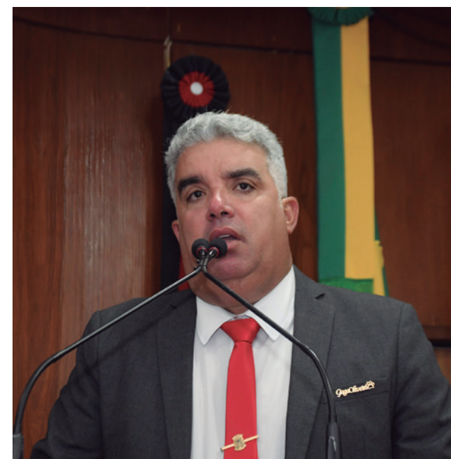
Guga Pet vai investir em ações em defesa dos animais

cidade, discutindo a situação dos ambulantes de João Pessoa — que, principalmente na orla da cidade, estão sendo tratados de forma desumana”, criticou.