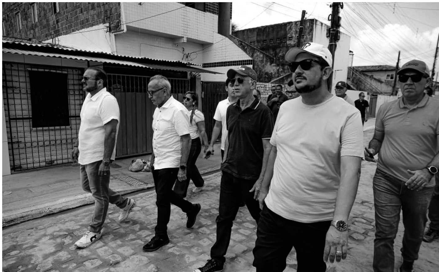
Acompanhado por vereadores, secretários e lideranças partidárias, o gestor fez a inauguração das ruas, de forma simbólica

“Dizíamos na campanha que seria importante ter mais prazo para que não fossem interrompidos os benefícios que estavam em andamento para a população. Isso aqui é a prova disso, porque estamos começando o man-