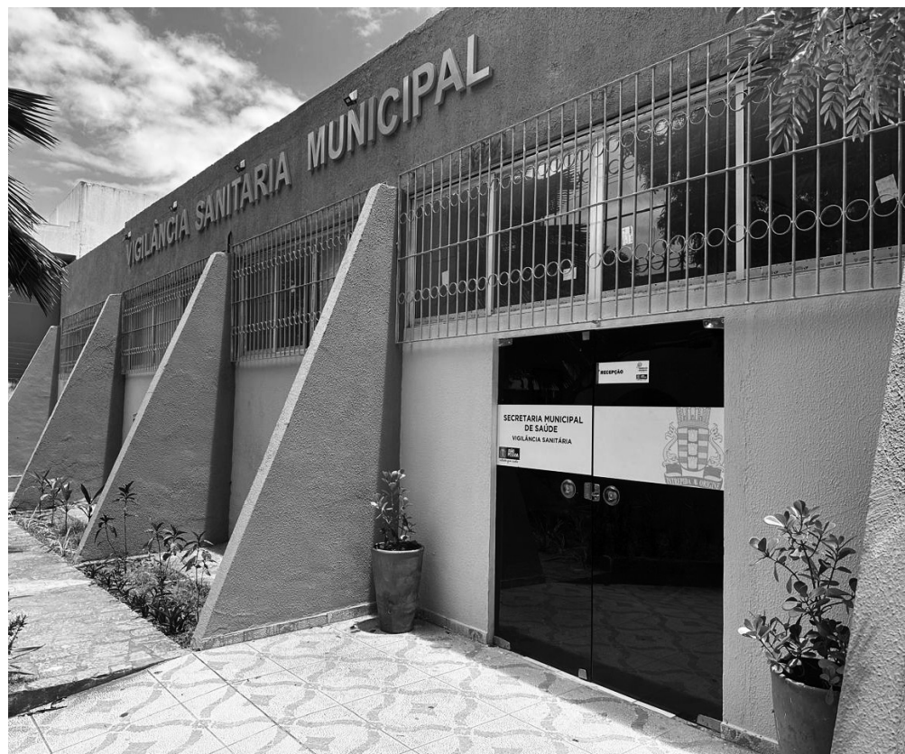
Órgão ressalta que uso, manipulação, comercialização e propaganda do produto estão proibidos

“A suspensão da manipulação, comercialização,