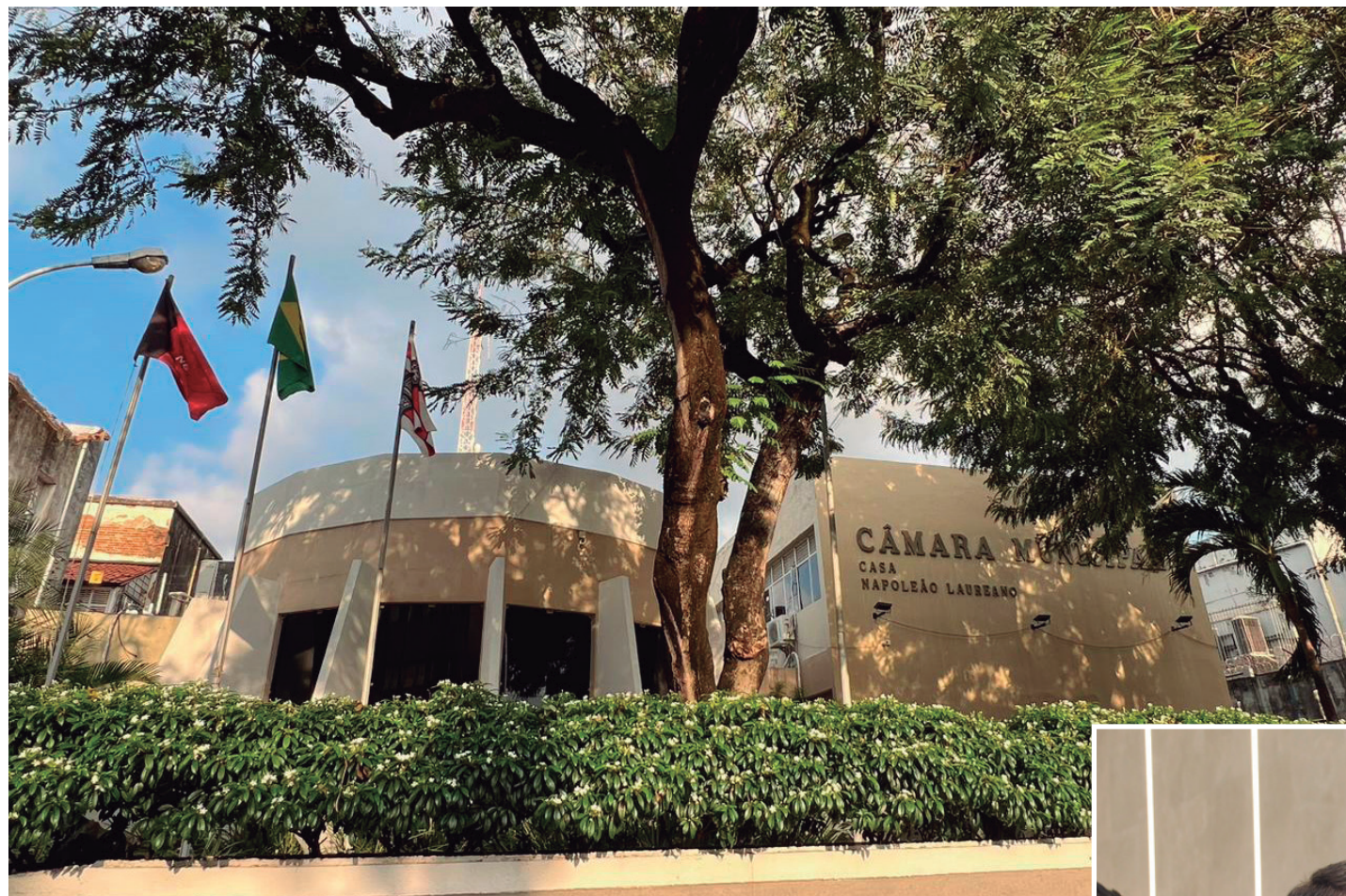
Câmara debaterá construção de sede recreativa no Bancários, em terreno já definido

A 19ª legislatura na Câmara Municipal de João Pessoa contará com a atuação de 29 vereadores, dos quais 25