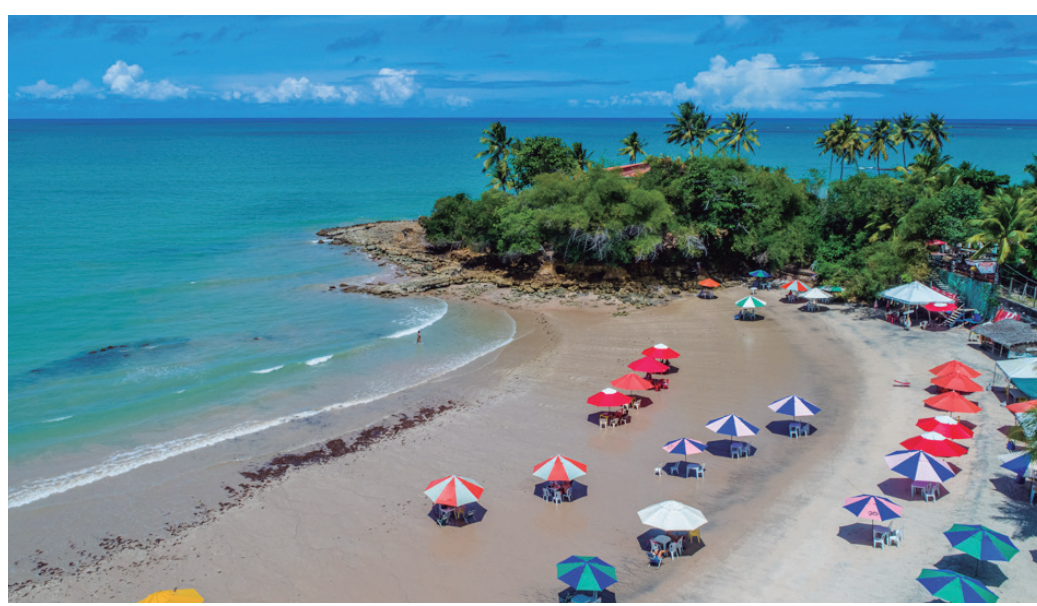
Serviço mantido pela PBTur oferece dados sobre opções de lazer no estado, como as praias

Entre as Cit que funcionam na Região Metropolitana de João Pessoa, estão as unidades situadas no Centro Turístico de Tambaú, na orla da cidade, e no Aeroporto Internacional Presidente Castro Pin-