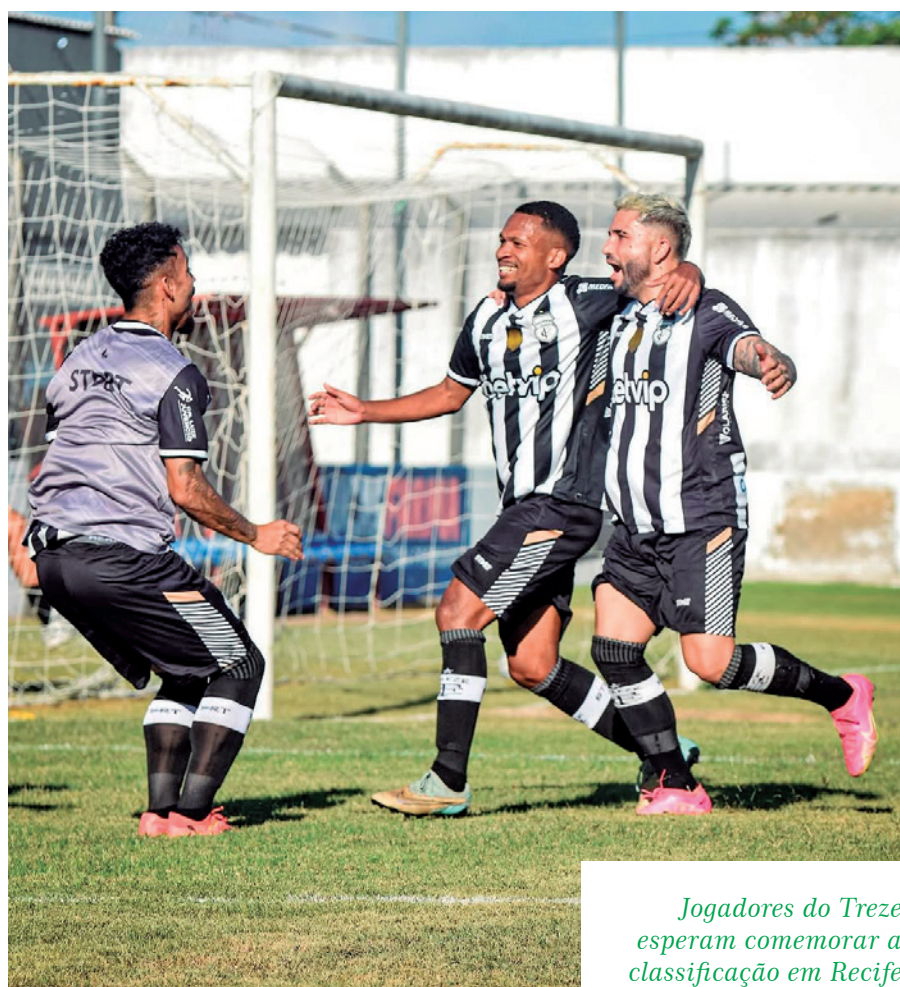
Jogadores do Treze esperam comemorar a classificação em Recife

Às 19h30, assim como Botafogo-PB e Maranhão, jogam ABC e Maracanã-CE, no Estádio Frasqueira, em Natal; Ferroviário e Santa Cruz-RN, no Estádio Presidente Vargas, em Fortaleza; e Retrô-PE e Moto Club-MA, na Arena Pernambuco, em São Lourenço da Mata.