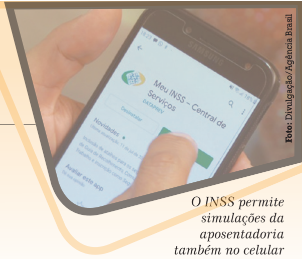
O INSS permite simulações da aposentadoria também no celular