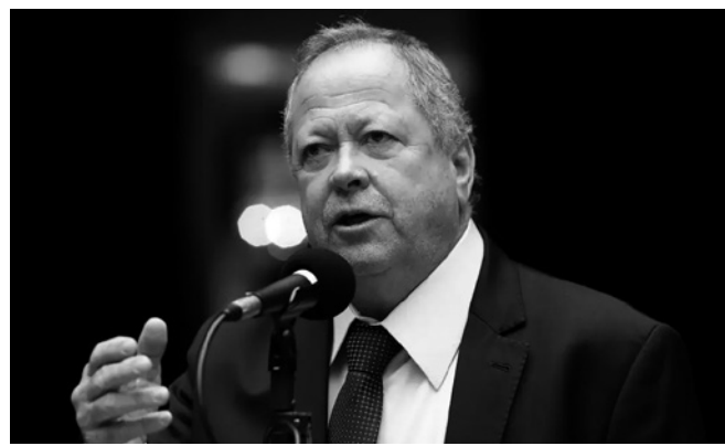
Deputado federal está preso desde março, em Campo Grande

■ Colapso é investigado pelo DNIT, que deve emitir um parecer em até 120 dias, prorrogáveis por igual período