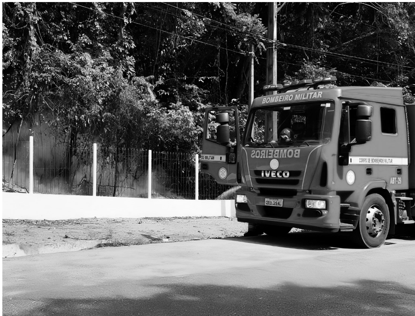
Causa do incêndio ainda não foi definida, mas o laudo apontando se foi motivado ou não por ação humana sairá nos próximos dias

■ Fumaça foi vista na Rua Tabelião Estanislau Eloy