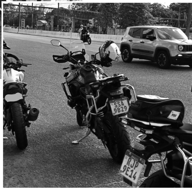
Inspeções ocorreram em João Pessoa, Bayeux e Mamanguape

Além disso, um homem de 27 anos foi preso, no km 143 da BR-230, em Campina Grande, abordagem de rotina em frente à unidade operacional da PRF. Após consulta aos sistemas, foi constatado que ele era procurado pela Justiça, sob acusação de homicídio. Um mandado de prisão preventiva havia sido expedido pela Comarca de Cabedelo. Diante da situação, o indivíduo foi levado à Central de Polícia Civil, onde ficará à disposição para cumprimento da pena imposta.